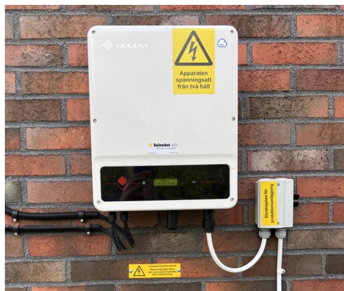
Exempel: Solverket GoodWe installation brytare